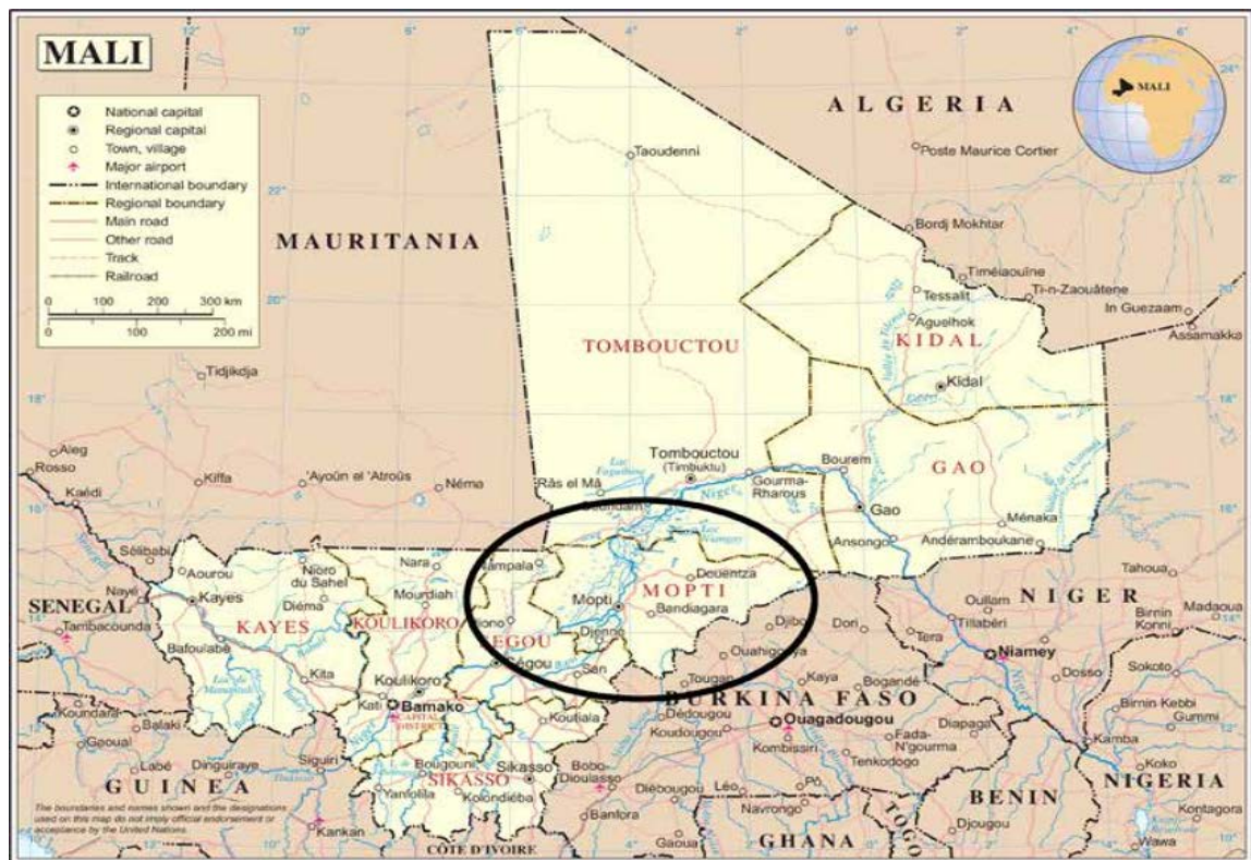
Figura 1. Mapa de Mali.

Si deseamos entender el actual contexto sociopolítico maliense debemos comenzar observando las propias características geopolíticas del país.