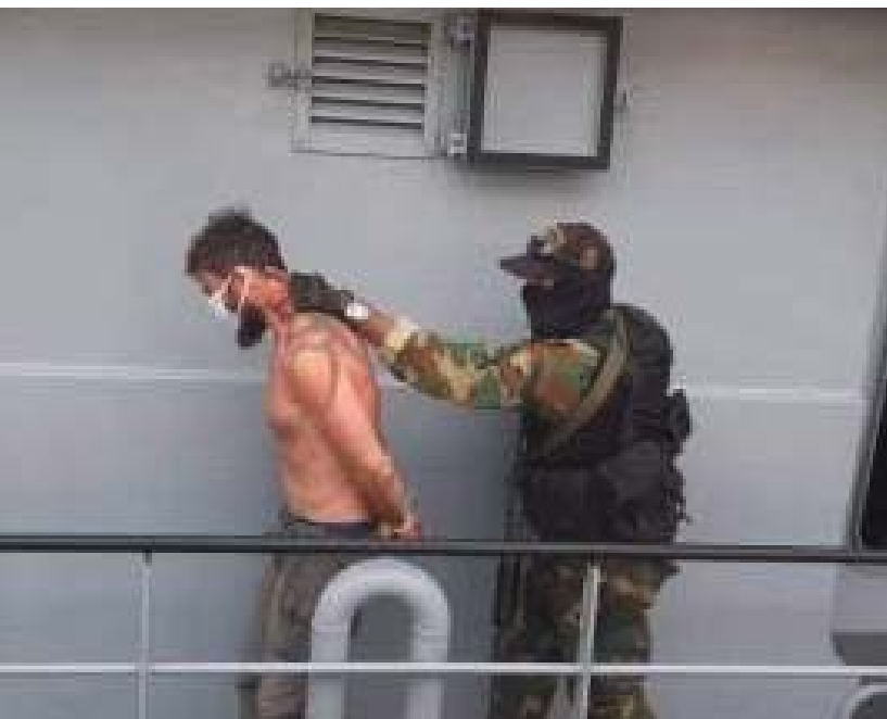
Los mercenarios capturados en Venezuela confesaron que parte del plan armado era la captura y asesinato de Nicolás Maduro.