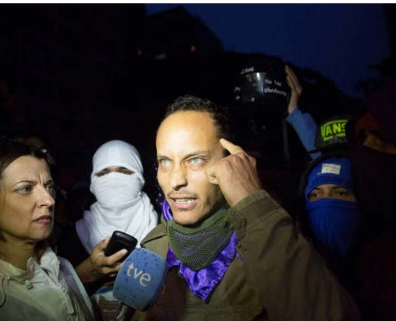
Oscar Pérez organizó células terroristas con las que logró atentar contra instituciones del Estado venezolano. (Foto: TVE).

la 6 mediante auspicio estadounidense y en clara violación de la Constitución venezolana. Con apoyo del gobierno norteamericano y de otros países como Colombia, participó en los eventos de Cúcuta del 22 de febrero de ese año, en el marco del Concierto “Venezuela Aid Live” 7 que suponía, recaudación de dinero y ayuda humanitaria para Venezuela.