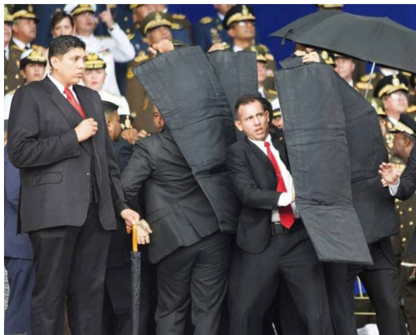
El 4 de agosto de 2018, terroristas venezolanos entrenados en Colombia atentaron contra el Presidente Nicolás Maduro y otras altas autoridades. (Foto: XINHUA).

A sólo pocas semanas de la violencia en los puentes internacionales entre Venezuela y Colombia, autoridades venezolanas mediante el Embajador Samuel Moncada denunciaron 12 ante el Consejo de Seguridad de la Organización de Naciones Unidas (ONU) que en Colombia se estaba conformando un “ejército de salvación” conformado por mercenarios para causar estragos en el país.