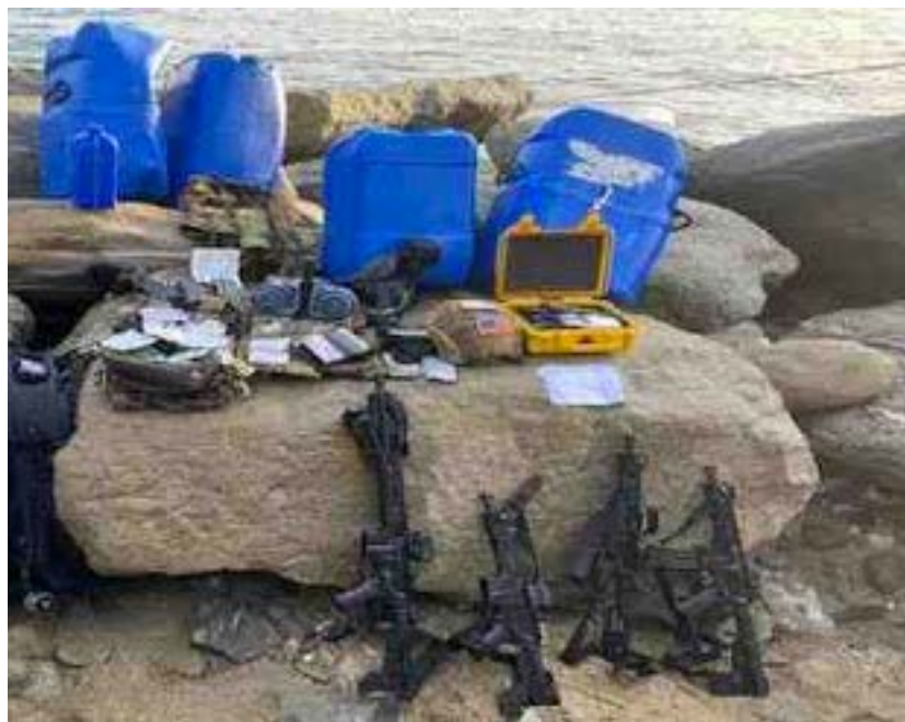
Parte del arsenal de armas incautadas al grupo de mercenarios que intentó desembarcar en la localidad de Macuto, estado La Guaira.

En la madrugada del 3 de mayo fue frustrada una incursión mercenaria en las costas de Macuto, en el estado La Guaira 27 . El ministro de Interior, Justicia y Paz de Venezuela, Néstor Reverol, informó que la FANB junto con las Fuerzas de Acciones Especiales (FAES) de la Policía Nacional Bolivariana (PNB) contrarrestaron una invasión por “vía marítima” en el litoral por parte de actores no estatales, denominada oficialmente “Operación Negro Primero”.