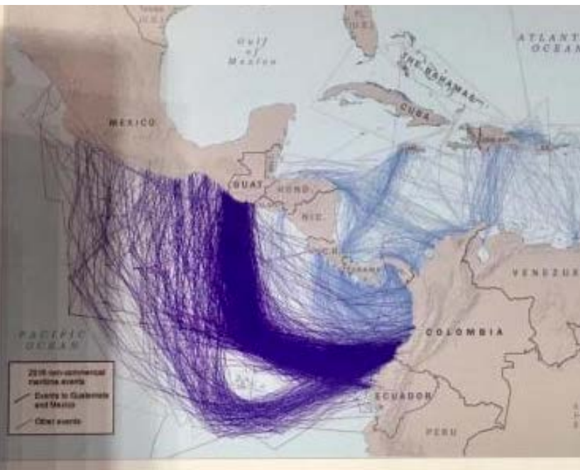
Rutas de tráfico de cocaína entre el norte de Sudamérica y el norte de América Central, con destino final Estados Unidos. (Gráfico: Comando Sur de los Estados Unidos).

Intentan posicionar a Venezuela como un “país de tránsito” de cocaína hacia Estados Unidos, aunque datos suministrados por el propio gobierno norteamericano indiquen lo contrario.